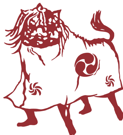
津市指定無形文化財 八幡獅子舞